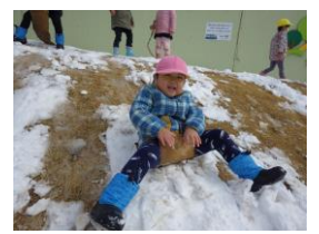
段ボールで滑ったり