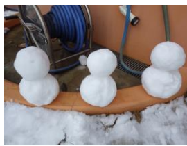
雪だるまを作ったり